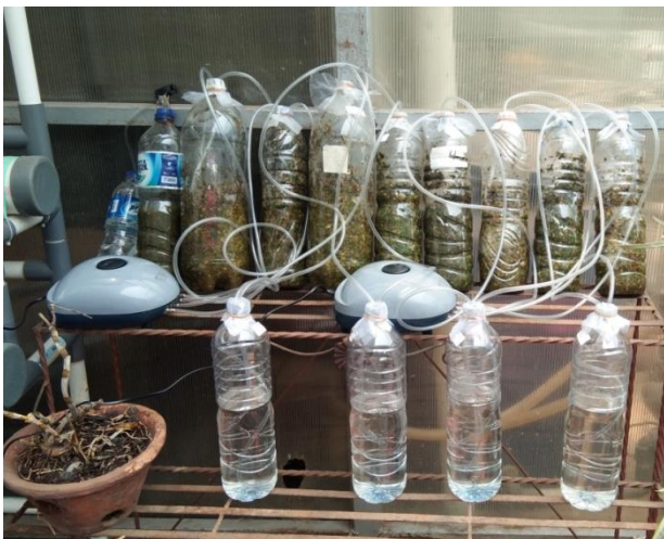
Gambar 1. Pembuatan Pupuk Organik Cair

Proses pembuatan pupuk organik cair sebagai bahan media pertumbuhan Spirulina sp. dilakukan beberapa kali karena metode awal yang digunakan untuk membuat pupuk organik tersebut tidak menghasilkan pupuk yang memenuhi kriteria yang diinginkan. Pupuk organik cair yang dapat digunakan oleh tumbuhan adalah pupuk yang memiliki karakteristik dengan warna coklat keruh, terdapat endapan, berbentuk cair dan memiliki tingkat kematangan sempurna yang ditandai dengan berbau khas fermentasi [11, 12]. Pupuk yang dihasilkan pada awal penelitian ini memiliki warna coklat keruh, terdapat endapan, berbentuk cair, namun tidak memiliki bau ciri khas fermentasi, melainkan menghasilkan bau yang busuk dan sangat menyengat. Sehingga, dilakukan beberapa modifikasi dalam pembuatan pupuk cair organik berdasarkan hasil komunikasi pribadi dengan orang yang berpengalaman dalam pembuatan pupuk cair organik. Pembuatan pupuk cair organik selanjutnya dilakukan dengan lebih tertutup dan proses pengadukan pupuk tidak dilakukan secara manual, melainkan secara otomatis dengan aliran udara yang dilewatkan selang yang berasal dari aerator (Gambar 1.). Sedangkan, untuk formulasi dan komposisi penggunaan bahan baku, masih sama dengan metode yang digunakan pada proses pembuatan pupuk sebelumnya.