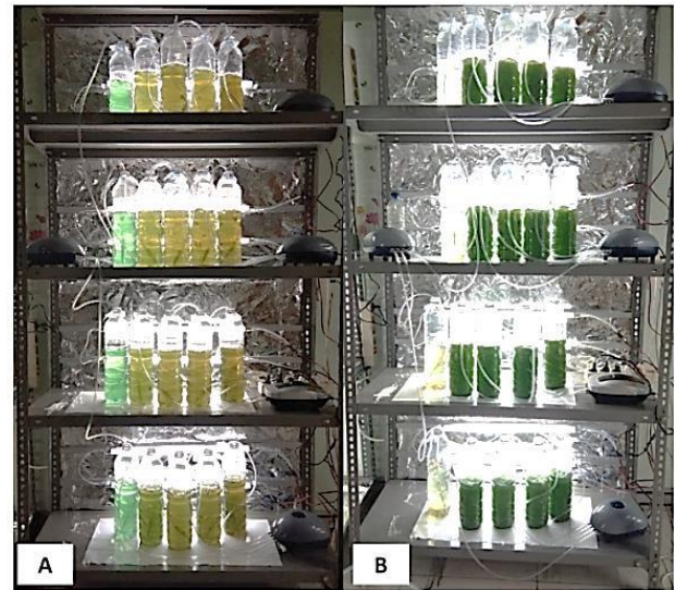
Gambar 3. Kondisi kultur Spirulina sp. pada awal (A) dan akhir (B) masa pengkulturan.

Kultur Spirulina sp. yang ditumbuhkan dengan media berbahan dasar pupuk organik cair dapat tumbuh dengan baik hingga hari ke-14 masa kultur (Gambar 3.). Grafik pertumbuhan Spirulina sp. yang dikulturkan selama 14 hari disajikan pada Gambar 2. Seluruh kultur Spirulina sp. dengan berbagai perlakuan mengalami fase adaptasi pada dua hari pertama masa kultur yang ditandai dengan penurunan jumlah sel. Masa adaptasi biasa terjadi pada saat kultur alga dipindahkan ke dalam medium baru. Fase ini merupakan adaptasi dari metabolisme sel alga untuk tumbuh [15]. Seluruh kultur Spirulina sp. mulai memasuki fase logaritmik setelah hari kedua masa kultur yang ditandai dengan meningkatnya kepadatan sel pada kultur yang terhitung pada hari ke-4. Fase logaritmik pada pertumbuhan mikroalga adalah fase dimana densitas sel meningkat secara eksponensial, laju pertumbuhan tetap dan konsentrasi meningkat [15]. Beberapa kultur Spirulina sp. (kontrol dan perlakuan POC 16mL/L) kemudian memasuki fase stasioner pada hari ke-6 dari masa kultur dimana dalam fase tersebut kepadatan sel yang terus meningkat mengakibatkan sel tersebut saling memperebutkan cahaya dan nutrisi, jumlah penambahan sel yang hidup dan yang mati seimbang sehingga konsentrasi sel cenderung konstan [15].