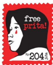
Gambar 2. Free Prita!

Salah satu elemen yang juga penting dalam upaya membangun relasi kuasa dalam kasus ini adalah dengan simbol non-kebahasaan. Bahasa gambar ini ternyata memainkan peran penting dalam memperkokoh penyebaran proses hegemonik teks. Contoh gambarnya adalah sebagai berikut: