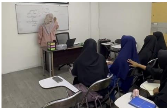
Gambar 5. Pelatihan Training to Trainer

Materi hari pertama menitikberatkan pada filosofi pendidikan kewirausahaan, penyusunan rencana pembelajaran berbasis proyek, teknik evaluasi sederhana, dan cara menyusun rubrik penilaian yang relevan dengan kompetensi santri.