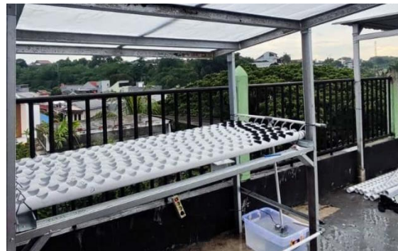
Gambar 8. Pemasangan Saluran NFT

Implementasi unit praktik sudah dilakukan pada skala percobaan dengan pemasangan sistem NFT untuk sayuran dan pembangunan unit budikdamber untuk budidaya lele, kedua unit tersebut telah diisi dan tahap pertumbuhan sedang berlangsung sehingga pada saat laporan ini disusun belum ada panen yang dapat dilaporkan. Pada sisi hidroponik, pemasangan saluran NFT dan pengisian larutan nutrisi berjalan sesuai rencana uji coba, benih sayuran cepat panen telah ditanam dan fase perawatan awal dilakukan oleh tim pengajar, namun pengamatan teknis awal menunjukkan fluktuasi pH pada larutan nutrisi yang memerlukan penyesuaian berkala dan pemantauan lebih intensif.