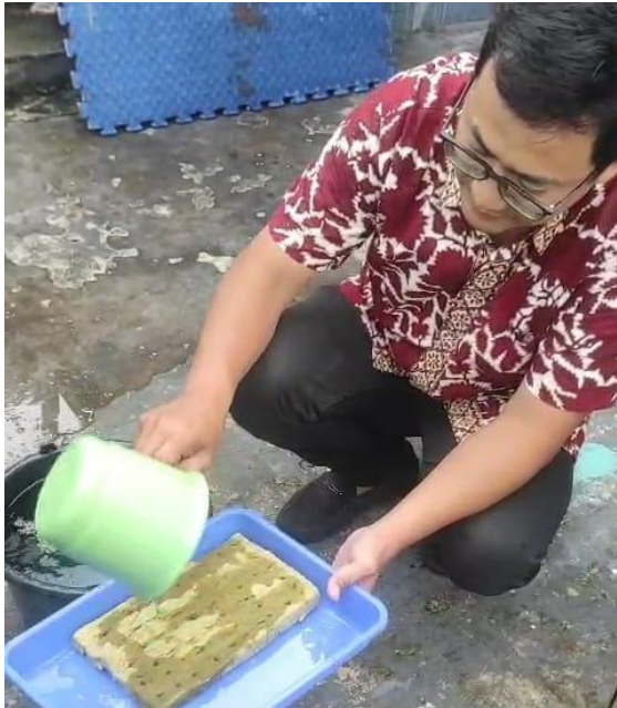
Gambar 7. Demonstrasi Penanaman Benih