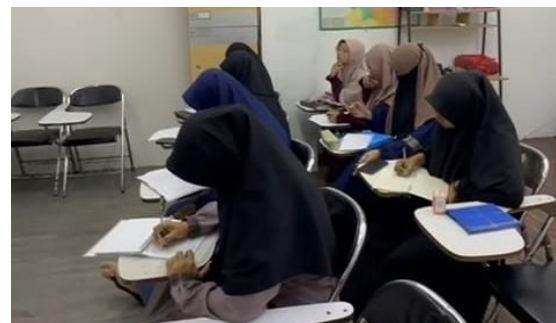
Gambar 4. Sosialisasi Luring

Sosialisasi yang dilakukan baik secara daring maupun luring menunjukkan bahwa peserta, termasuk Ketua Yayasan Askaf dan lima calon pengajar, memahami dengan baik visi program pengabdian dan struktur kurikulum kewirausahaan. Para calon pengajar dalam pelatihan ini hanya memiliki kepakaran utama di bidang Al-Qur'an dan Bahasa Arab, dengan pengalaman panjang sebagai pengajar tetap di Rumah Qur'an Askaf (RQA) maupun sebagai alumni RQA yang telah melalui proses pembinaan intensif.