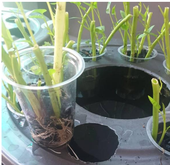
Gambar 9. Budikdamber Lele

tidak berbenturan dengan kewajiban mengajar para pengajar, mekanisme rotasi tugas yang terjadwal dengan baik dipandang perlu untuk memastikan kontinuitas perawatan tanpa mengganggu kegiatan sekolah dan asrama. Keempat, format pencatatan yang telah dipakai perlu distandarisasi agar memudahkan analisis kuantitatif pada evaluasi pasca panen pertama, kolom yang direkomendasikan meliputi tanggal, parameter lingkungan, tindakan yang diambil, jumlah pakan, mortalitas, dan estimasi pertumbuhan.