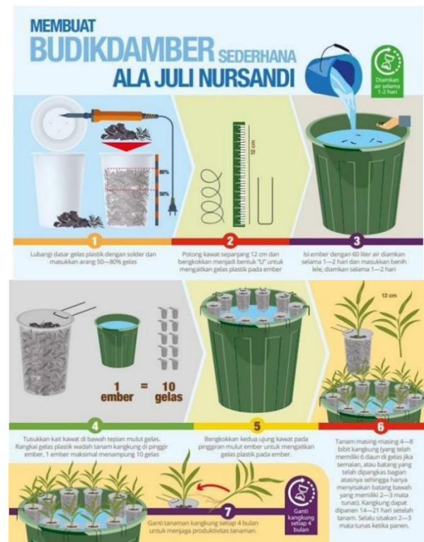
Gambar 2. Cara Membuat Budikdamber

untuk membuka usaha sendiri maupun bekerja di lini usaha yang sejenis.