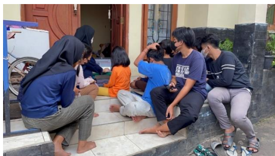
Gambar 1. Sosialisasi Kepada Pelajar RT 06 / RW 007

Adapun materi yang diberikan yaitu cara mengakses website KEMDIKBUD. Sosialisasi ini dilakukan agar pelajar tetap bisa bermain gadget sambil menambah pengetahuan di website tersebut. Kemudian dilkukan sosialisasi yaitu dengan menjelaskan terkait website , pemutaran video, mendemonstrasikan, dan penyebaran poster. Setelah melakukan sosialisasi, kemudian dilakukan penyebaran google form kepada warga RT 06 / RW 007 mengenai evaluasi dari program kerja yang dilakukan.