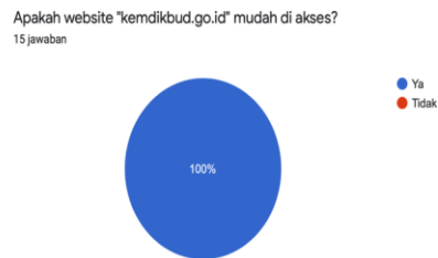
Gambar 7. Respon Hasil Kemudahan Akses pada Website

Dari program-program kerja yang telah disosialisasikan kepada warga RT 06 / RW 007, kemudian dilakukan penyebaran kuesioner kepada warga yang telah mendapatkan sosialisasi tersebut menggunakan google form .