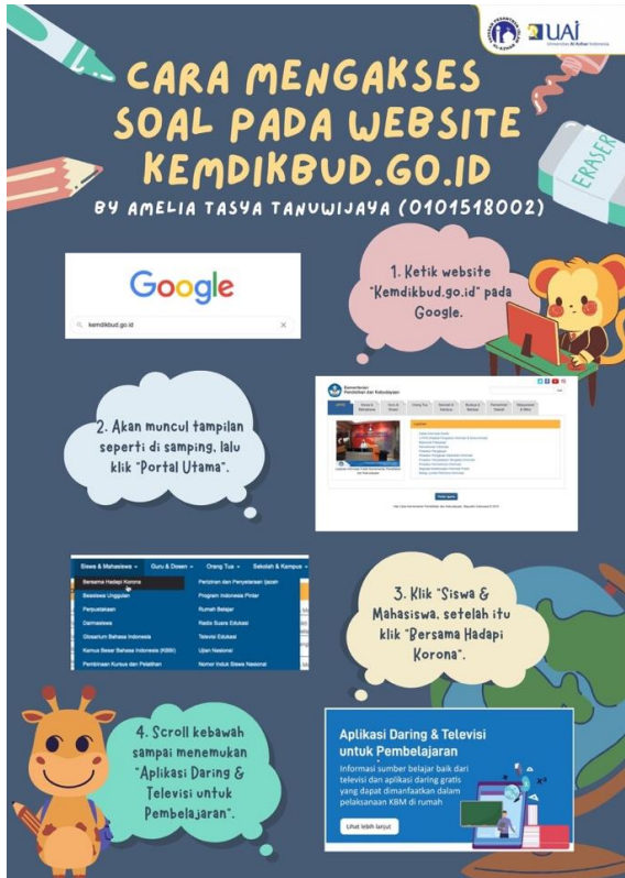
Gambar 5. Poster Cara Mengakses Website KEMDIKBUD

Pada Gambar 4 ditunjukkan simulasi mengakses Website KEMDIKBUD. Kegiatan simulasi dilakukan setelah sosialisasi, memaparkan video dan memberikan manual book .