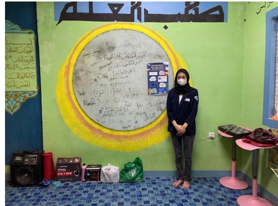
Gambar 6. Penempelan Poster

materi pembelajaran hingga bank soal dapat diakses pada fitur ini.