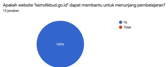
Gambar 8. Respon Hasil Website dapat Menunjang Kegiatan Pembelajaran

Pada Gambar 7 disajikan hasil pasca kuesioner. Pada hasil tersebut diketahui bahwa, pada website ini mudah untuk diakses baik untuk semua kalangan pelajar.