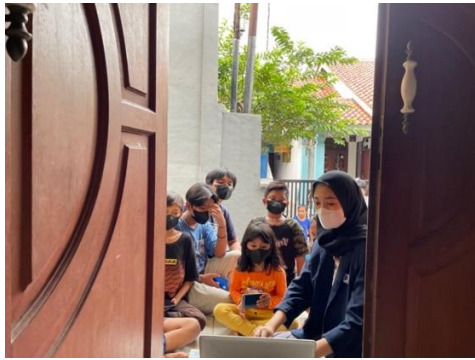
Gambar 4. Simulasi Mengakses Website KEMDIKBUD

Pada Gambar 4 ditunjukkan simulasi mengakses Website KEMDIKBUD. Kegiatan simulasi dilakukan setelah sosialisasi, memaparkan video dan memberikan manual book .