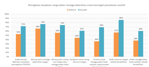
Gambar 4. Hasil Evaluasi Program

Evaluasi dilakukan menggunakan kuesioner untuk mengetahui tingkat ketertarikan dan kesadaran warga dalam menjaga kesehatan dalam mencegah penyebaran covid19. Kuesioner terdiri dari 20 pertanyaan dengan melihat pada empat aspek yakni Stimuli (Facility), Cognitive, Affective, dan Behavior .