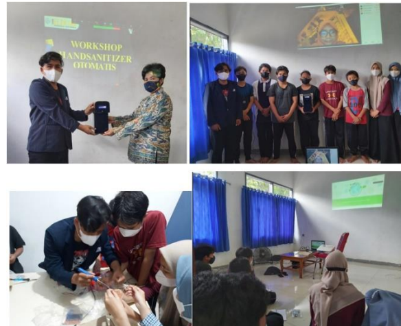
Gambar 3. Kegiatan penyerahan dan pelatihan TOSAN hand sanitizer

dan Rempoa Tangerang Selatan, ditunjukkan pada Gambar 3. Rangkaian kegiatan pelatihan terdiri dari Edukasi 3M, penyerahan TOSAN, pelatihan Pembuatan TOSAN, dan pelatihan mengenai renewable energy berbasis solar cell .