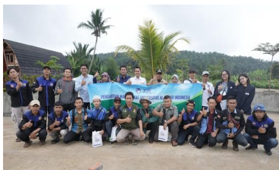
Gambar 4. Foto Bersama Usai Pelatihan Budidaya Maggot Dengan Jajaran Karang Taruna & Tim Abdimas UAI, 8 September 2022