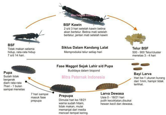
Gambar 2. Siklus Hidup Larva Maggot BSF Sebagai Pengurai Sampah Organik