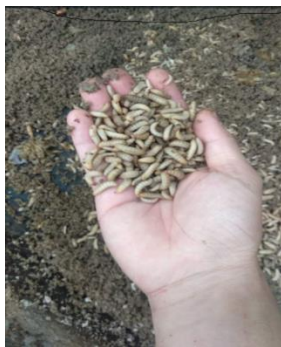
Gambar 7. Hasil Pendampingan : Maggot BSF Tumbuh Sehat & Gemuk

Saat Pendampingan: Periksa Kandang BSF dan BSF Hinggap di Daun Kering Dalam Kandang