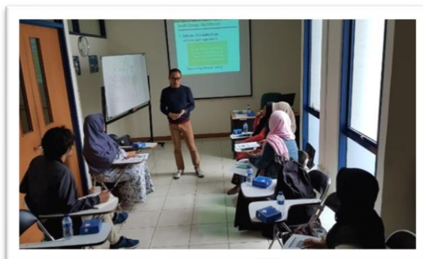
Gambar 2. Kegiatan di kelas