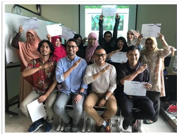
Gambar 3. Gambar Acara Penutupan