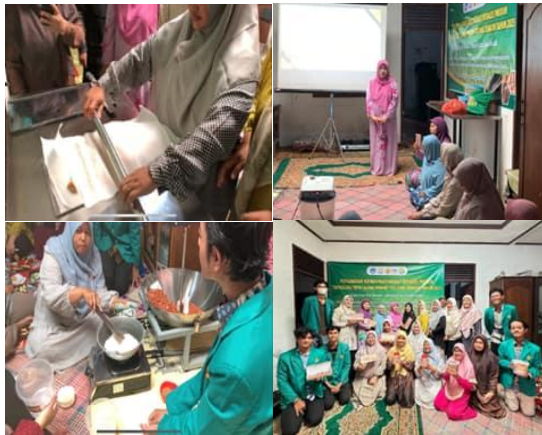
Gambar 4. Demonstrasi dan pelatihan penggunaan peralatan yang diserahkan kepada mitra.

Penerapan TTG ini dilakukan dengan melibatkan langsung mitra sebagai pengguna utama teknologi. Partisipasi masyarakat (ibu-ibu rumah tangga dan pekerja sekitar) cukup tinggi, terlihat dari keikutsertaan aktif dalam pelatihan CPPOB dan penggunaan alat baru, pengoperasian alat TTG secara mandiri oleh mitra setelah tahap uji coba, antusiasme masyarakat sekitar yang tertarik untuk mengadopsi teknologi serupa bagi usaha kecil lainnya. Relevansi teknologi ini sangat tinggi karena sesuai dengan kebutuhan lokal, mudah digunakan, hemat energi, dan meningkatkan efisiensi produksi tanpa memerlukan keahlian teknis yang rumit.