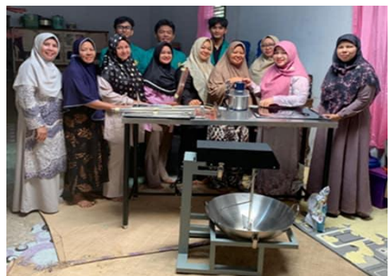
Gambar 3. Serah terima alat pencacah kacang tanah otomatis, alat sangrai kacang tanah otomatis, alat cetakan kipang kacang beserta alat penekan adonan kacang ( roller ), meja produksi kepada mitra.

Penerapan teknologi telah dilakukan dengan mengimplementasikan teknologi