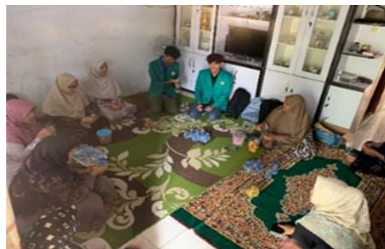
Gambar 2. Penyuluhan kepada mitra pengabdian

Kegiatan PKMBP-TTG pada industri kecil di Kabupaten Aceh Besar oleh tim pengabdian Fakultas Pertanian Universitas Syiah Kuala telah berjalan dengan baik. Industri kecil yang memperoleh pendampingan adalah UMKM Kranciis Snack yang terdiri dari ibu-ibu rumah tangga yang bergerak dibidang pengolahan kipang kacang. Program pengabdian kepada masyarakat ini dilakukan dengan metode penyuluhan, penerapan teknologi, dan bimbingan teknik. Penyuluhan telah dilakukan pada mitra dengan memberikan pemahaman tentang teknologi yang akan digunakan (Gambar 2).