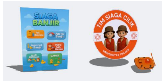
Gambar 4. Menu Dalam AR “Siaga Cilik”

Struktur menu dalam AR “Siaga Cilik” yang dirancang untuk memfasilitasi pemahaman mitigasi banjir melalui visualisasi 3D yang ramah anak (Gambar 4). Menu seperti pengenalan banjir , jalur evakuasi , dan tas siaga memungkinkan penyampaian informasi secara bertahap dan interaktif, sehingga konsep yang abstrak dapat dipahami melalui pengalaman