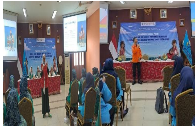
Gambar 2. Sesi Pelatihan I Bersama Basarnas dan Tim PKM

penyusunan SOP secara bertahap, mulai dari perumusan tujuan hingga penetapan peran dan tanggung jawab, dengan pendampingan intensif agar SOP yang dihasilkan aplikatif dan mudah diimplementasikan.