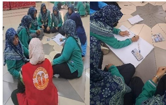
Gambar 3. Sesi Pelatihan II Penyusunan SOP Tanggap Bencana dan Integrasi AR

Selanjutnya dari sisi kelembagaan, keempat PAUD mitra kini memiliki SOP tanggap bencana yang disusun secara kolaboratif dapat dilihat pada gambar 3. SOP tersebut dipasang di ruang kelas dan area publik sekolah sehingga mudah diakses. Guru dan pengelola merasa lebih siap menghadapi kondisi darurat karena memiliki pedoman yang jelas. Hal ini mendukung rekomendasi Badan Nasional Penanggulangan Bencana (BNPB) (2025) tentang pentingnya SOP di sekolah sebagai bagian dari program Sekolah/Madrasah Aman Bencana. SOP ketanggapan bencana disesuaikan dengan keadaan sekolah dapat dilakukan juga seperti pada tabel 5 sebagai berikut.