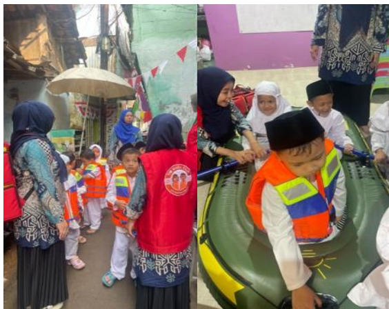
Gambar 6. Simulasi Evakuasi

Dampak positif juga terlihat dalam pelaksanaan simulasi evakuasi banjir (Gambar 6). Anak-anak di PAUD Latansa Salaf dapat bergerak menuju titik kumpul dengan tertib sambil menyanyikan lagu mitigasi, sementara guru menggunakan modul sebagai panduan pembagian peran dan prosedur. Dengan cara ini, SOP tanggap bencana yang disusun tidak hanya menjadi dokumen administratif, tetapi benar-benar dipraktikkan dalam aktivitas sehari-hari. Hal ini juga sejalan dengan hasil penelitian Pacheco et al. (2022), yang menekankan bahwa sekolah berfungsi tidak hanya sebagai tempat belajar, tetapi juga sebagai ruang aman fisik, sosial, dan emosional untuk memperkuat resiliensi anak.