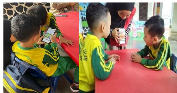
Gambar 5. Simulasi AR di lembaga PAUD

Pendampingan implementasi menunjukkan bahwa integrasi ketiga media tersebut berjalan efektif. Anak-anak diajak menggunakan AR untuk mengenali jalur evakuasi, kemudian menguatkannya dengan lagu mitigasi yang dinyanyikan bersama-sama, dan akhirnya mempraktikkan simulasi evakuasi dengan panduan modul dapat dilihat pada gambar 5.