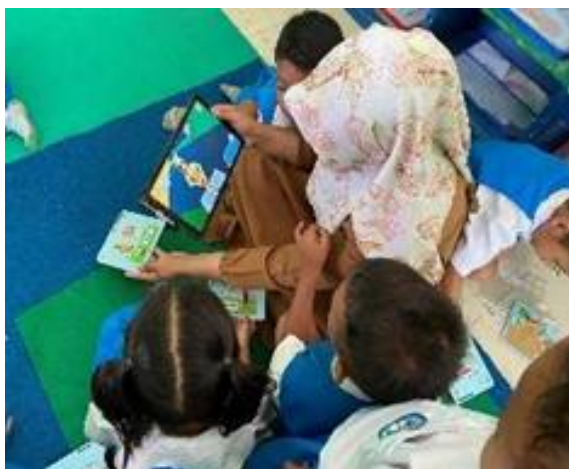
Gambar 7. Implementasi aplikasi AR di Kelas

Dalam tema “Negaraku”, lagu daerah Kaili dinyanyikan sambil anak menyaksikan animasi pakaian adat muncul melalui marker .