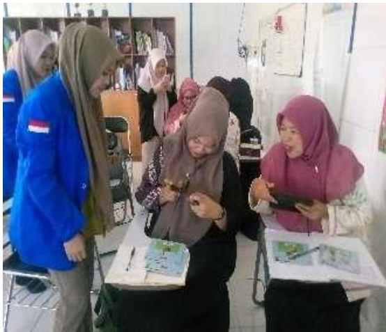
Gambar 5. Praktik Menggunakan AR

teknologi, tetapi juga dapat merancang alur pembelajaran berbasis digital yang lebih bermakna. Latihan ini dipandu secara bertahap oleh tim pelaksana, dimulai dari mengunduh aplikasi, mengakses marker, hingga menyusun rencana pembelajaran yang mengintegrasikan media AR dengan tema yang sesuai seperti “Diriku”, “Lingkunganku”, dan “Negaraku” (Gambar 5).