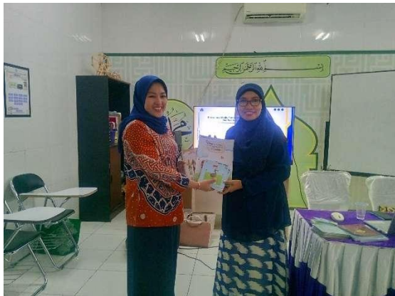
Gambar 6. Penyerahan Perangkat AR

Guru mitra mengimplementasikan media ini dalam kegiatan pembelajaran tematik, seperti tema “Diriku”, “Negaraku”, dan “Lingkunganku”. Contohnya, saat membahas tema “Lingkunganku”, anak-anak diajak memindai gambar rumah adat Kaili dan melihat versi 3D-nya muncul di layar ponsel. Gambar 6 merupakan proses penyerahan Perangkat AR.