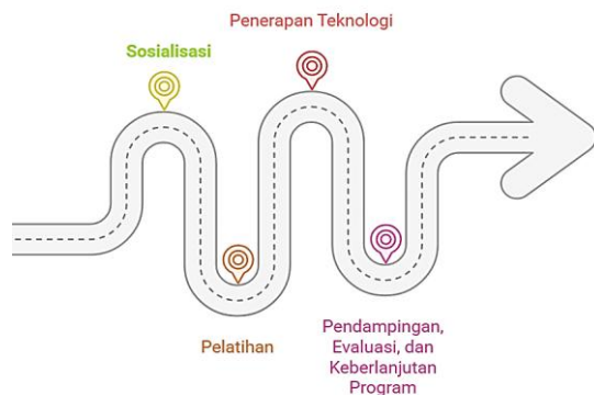
Gambar 3. Tahapan Pengabdian Kepada Masyarakat

Alur pengabdian ini dimulai dengan sosialisasi untuk memperkenalkan program kepada guru PAUD dan stakeholder, menjelaskan tujuan serta manfaat pemanfaatan media pembelajaran berbasis AR. Selanjutnya, guru diberikan pelatihan langsung mengenai cara merancang dan menggunakan media AR yang mengangkat budaya lokal Suku Kaili. Setelah itu, guru menerapkan media tersebut secara langsung dalam proses belajar mengajar. Tahap terakhir meliputi pendampingan, evaluasi efektivitas penggunaan media, dan upaya memastikan keberlanjutan pemanfaatan AR guna meningkatkan interaktivitas pembelajaran sekaligus memperkuat identitas budaya lokal anak.