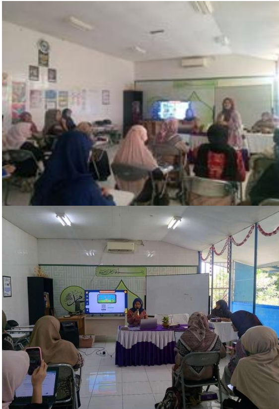
Gambar 4. Penyampaian Materi Pelatihan

secara rinci tentang konsep dasar AR, potensi penerapannya dalam konteks pembelajaran anak usia dini, serta peran guru dalam menciptakan lingkungan belajar yang inovatif dan berbasis teknologi. Selain itu, peserta juga diperkenalkan dengan rencana kegiatan pelatihan, pendampingan, dan evaluasi yang akan dilaksanakan (Gambar 4).