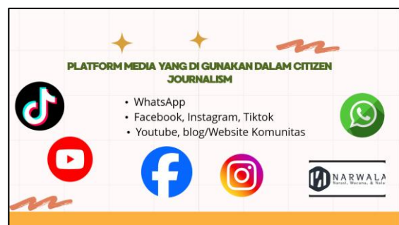
Gambar 3. Pengenalan Teknologi Berupa Media Sosial sebagai Alat Citizen Journalism

Salah satu aspek utama pada tahap ini adalah pengenalan penggunaan media sosial. Media sosial dipilih karena sifatnya yang inklusif, murah, serta memiliki jangkauan luas dalam menyebarkan informasi. Peserta diperkenalkan dengan platform yang umum digunakan, seperti Facebook , Instagram , YouTube , dan WhatsApp , yang secara praktis sudah tidak asing lagi dalam kehidupan sehari-hari masyarakat. Namun, pada tahap ini peserta tidak hanya diajarkan cara menggunakan media sosial secara teknis, tetapi juga bagaimana mengelola konten agar memiliki nilai informatif, edukatif, serta advokatif. Misalnya, peserta diarahkan untuk membuat unggahan yang menampilkan potret kehidupan sehari-hari komunitas adat, dokumentasi ritual adat, atau isu-isu aktual yang berkaitan dengan perlindungan hak ulayat. Dengan begitu, media sosial bukan hanya berfungsi sebagai ruang hiburan, tetapi menjadi medium strategis untuk memperluas narasi dan memperjuangkan kepentingan masyarakat adat.