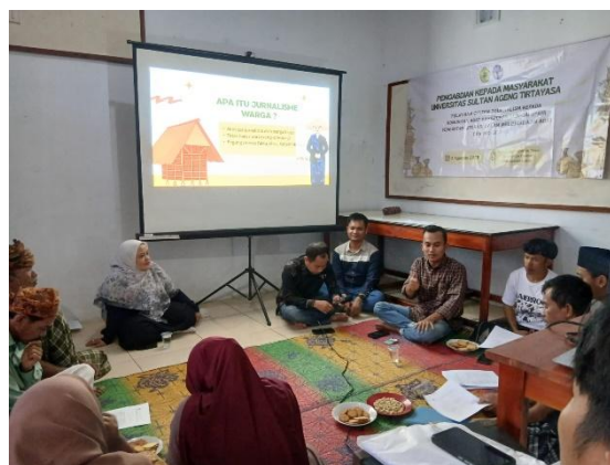
Gambar 1. Kegiatan Pelatihan Citizen Journalism

berita singkat berbasis fakta lapangan, serta cara memanfaatkan gawai sederhana untuk produksi konten. Materi literasi digital disampaikan untuk membekali peserta dengan kemampuan mengunggah dan membagikan informasi melalui media sosial, blog komunitas, atau platform crowd journalism . Pada sesi ini, peserta diperkenalkan dengan strategi keamanan digital agar data dan dokumentasi yang dimiliki tidak mudah disalahgunakan pihak luar.