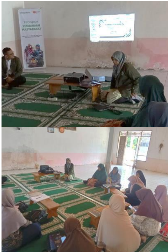
Gambar 3. Pemaparan Materi Mandi Wajib

Untuk mengukur tingkat keberhasilan setelah dilakukannya kegiatan pengabdian tersebut, pelaksana telah menyebarkan posttest kepada 13 orang peserta kegiatan pengabdian. Hasil posttest tersebut menunjukkan terjadinya peningkatan pemahaman peserta terkait permasalahan seputar mandi wajib yang telah dipaparkan oleh pemateri.