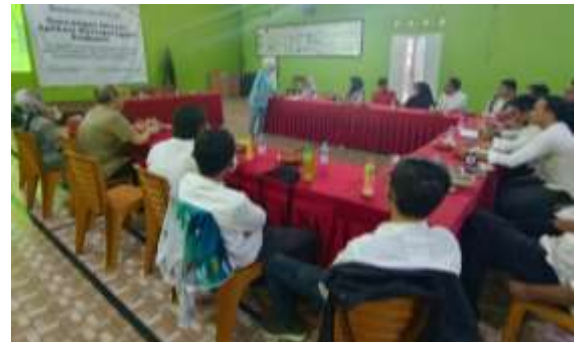
Gambar 3. Pelaksanaan Sosialisasi

sehingga fokus pada fase kesiapsiagaan. Materi lainnya menjelaskan tentang apa saja dampak dari bencana dalam situasi tanggap darurat. Selanjutnya dijelaskan perlunya mitigasi risiko bencana dengan pembentukan desa persaudaraan agar mengurangi risiko bencana dengan lebih terukur.