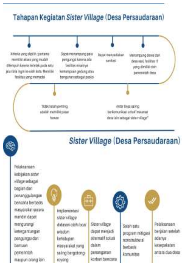
Gambar 2. Contoh Materi sosialisasi tentang kondisi saat tanggap darurat bencana dan konsep desa persaudaraan.

Pelaksanaan sosialisasi dihadiri oleh seluruh perwakilan dari 7 desa di kecamatan Pacet, Kabupaten Cianjur Jawa Barat yang terdiri dari 15 orang. Sosialisasi juga menawarkan rencana pembuatan aplikasi untuk mendukung pembentukan desa persaudaraan ( sister village ).