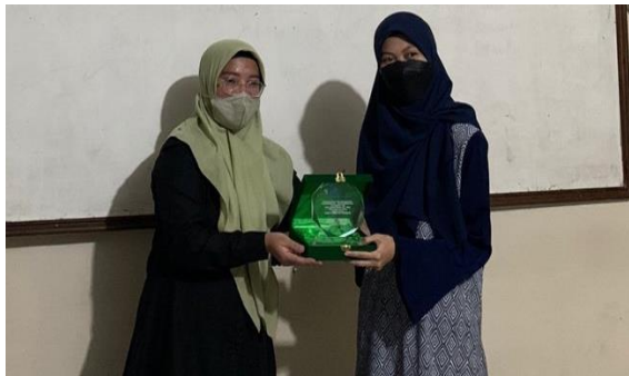
Gambar 7. Penyerahan Plakat dari Dosen Kepada Perwakilan Pengurus RGI

para santri yang sudah membuat karya dari aplikasi Canva dan Pivot Table dengan hasil terbaik, diberikan hadiah berupa kotak makan, tumbler minum, payung dan pulsa, yang dipersiapkan oleh dosen dan mahasiswa dengan tujuan memberi semangat kepada para santri dalam mempersiapkan diri untuk menjalankan kegiatan magang nantinya.