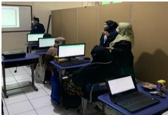
Gambar 5. Pemaparan Materi Pivot Table dan Pivot Chart