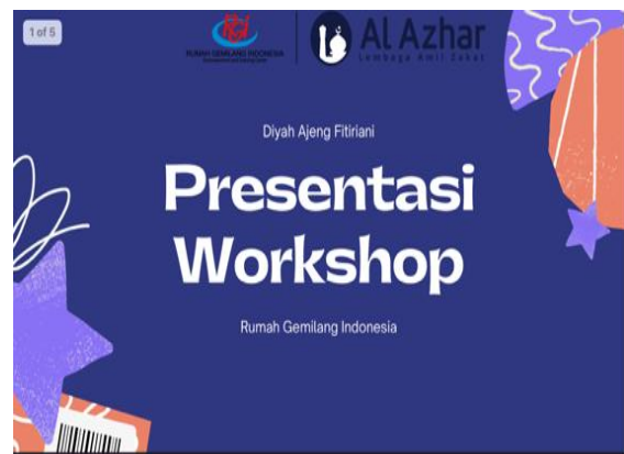
Gambar 3. Hasil Praktik Canva oleh Peserta