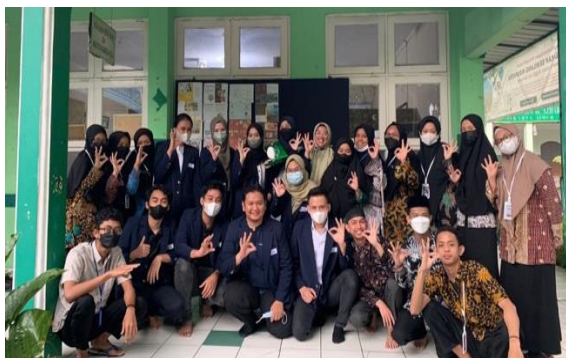
Gambar 8. Dosen dan Mahasiswa Beserta Santri Peserta Workshop