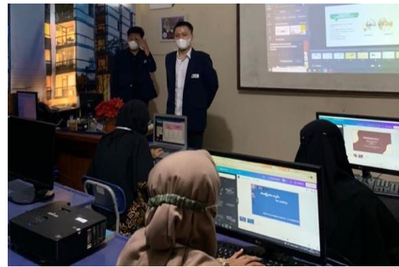
Gambar 2. Pemaparan Materi Canva

pemaparan materi oleh tim dan contoh hasil praktik Canva yang dibuat oleh para peserta.