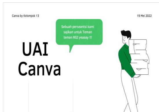
Gambar 1. Materi Canva

Pada pemaparan awal, tim menjelaskan bahwa Canva bisa didapatkan secara gratis dan berbayar. Canva bisa diakses melalui perangkat desktop maupun mobile phone . Canva bisa digunakan untuk membuat presentasi dan berbagai macam desain menarik seperti: logo, poster, banner iklan, invoice, desain kemasan produk, thumbnail Youtube, infografik, newsletter, featured image blog dan konten media sosial. Kepada para peserta diinstruksika untuk dapat mengakses Canva melalui website dengan membuka laman http://www.canva.com .