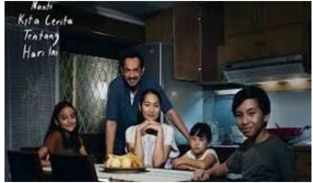
Gambar 7. Adegan di ruang makan posisi ayah sebagai tulang punggung sekaligus menentukan

Sikap tegas yang ditetapkan Sang Ayah bagi semua anggota keluarga dalam menanggapi musibah keluarga tersebut, serta mendominasi dalam berbagai kejadian maka Sang Ayah dideskripsikan menjadi “ King of The Rule ” untuk bisa menentukan boleh atau tidaknya apa yang dilakukan pada setiap anggota dalam keluarga. Sentral keluarga itu adalah Sang Ayah, isteri dan anak-anak hanya diminta patuh atas keputusan yang telah ditetapkan.