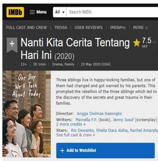
Gambar 4. Film NKCTHI (IMDb.com)

Melalui film akan disampaikan pesan tertentu ( message ) melalui gambar, dialog, setting gambar, penokohan, plot alur cerita, simbol-simbol, musik dan apa yang disajikan di layar lebar. Film mampu secara efektif digunakan sebagai media untuk menyebarkan misi, gagasan, dan kampanye apapun pesan yang akan disebar atau disampaikan seseorang, lembaga atau pemerintah.