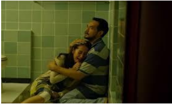
Gambar 5. Adegan kesedihan ibu yang kehilangan seorang bayi kembar yang meninggal

Dalam kisah film NKCTHI yang dimaksud trauma ‘luka’ besar dalam keluarga itu adalah kehilangan salah satu anak kembar mereka (kembaran Si Bungsu, Awan ) yang meninggal sesaat kelahiran. Berharap bisa menghapus musibah keluarga itu, Sang Ayah melarang isterinya dan anak-anak agar tidak larut dalam kesedihan. Berusaha mengubur kisah sedih itu dalam-dalam, setiap anggota tidak dibolehkan Sang Ayah bersikap murung. Namun di kemudian hari, sikap yang mengabaikan rasa sedih, kecewa, merasa gagal ini menyisakan permasalahan dalam menyikapi persoalan kehidupan mereka sehari-hari.