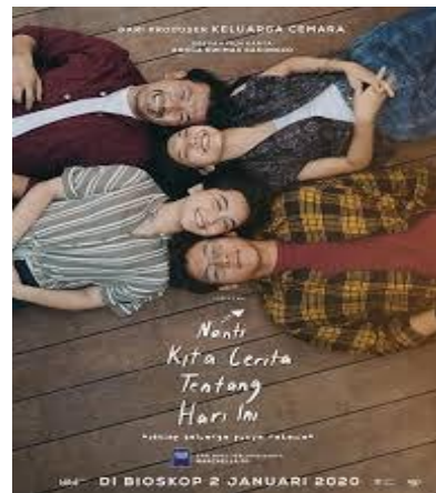
Gambar 2. Poster Film NKCTHI