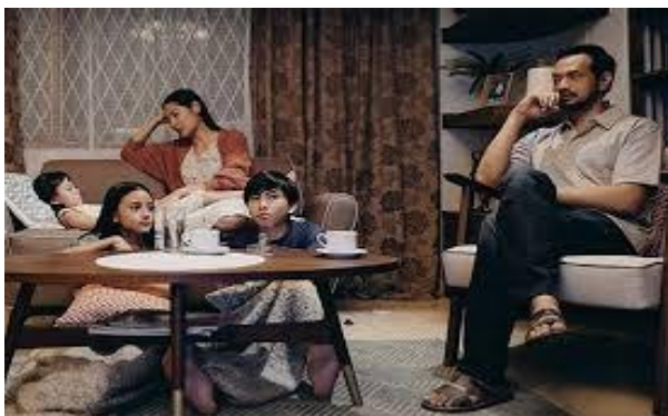
Gambar 6. Adegan di ruang keluarga dimana peran Ayah tergambar dominan dan pemegang otoritas

Dalam kisah film NKCTHI yang dimaksud trauma ‘luka’ besar dalam keluarga itu adalah kehilangan salah satu anak kembar mereka (kembaran Si Bungsu, Awan ) yang meninggal sesaat kelahiran. Berharap bisa menghapus musibah keluarga itu, Sang Ayah melarang isterinya dan anak-anak agar tidak larut dalam kesedihan. Berusaha mengubur kisah sedih itu dalam-dalam, setiap anggota tidak dibolehkan Sang Ayah bersikap murung. Namun di kemudian hari, sikap yang mengabaikan rasa sedih, kecewa, merasa gagal ini menyisakan permasalahan dalam menyikapi persoalan kehidupan mereka sehari-hari.